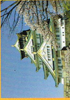
Osaka Guide Tour