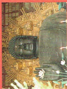
奈良・京都ツアー