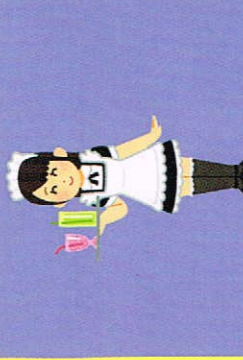
サブカルチャー 等色々入りツアー

大阪府南部歴史の町、平野郷にある小さな旅行社です。 地域密着型のユニークなツアーを企画・募集しています。 4800円(昼食・添乗員付)で、気軽に参加できる日帰りツアー 「大人の遠足シリーズ」(公共交通機関利用)が人気です。 その他、お仲間同士の各種バスツアー等の手配も可能です。 英語通訳案内士や添乗員も常駐。お気軽にお問合せ下さい。