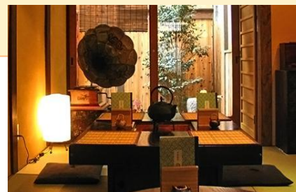
お弁当は和風喫茶店「おもしろ庵」