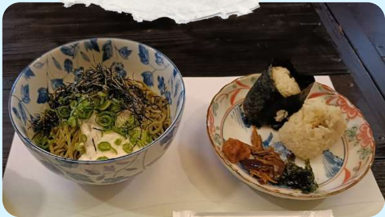
茶そばとおにぎり(イメージ)